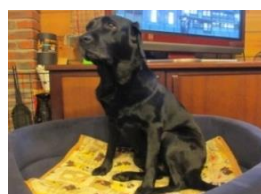
今月のnaviちゃん 切トハス です。

◎温泉三昧! 我が家には温泉が引いてあります。温泉管理料は掛かりますが、年間を通じてご覧のような温度で供給されてます。源泉は54°C超、我が家には50度程度で届きます。熱過ぎるので、汲み置きして温度を下げます。ふる場はユニットバスなのでポイラーでの給湯も可能です。足元の給湯栓が温泉専用で、かけ流しにして入浴します。身体を伸ばしてのんびり入浴です。一応モザイク?かけました。