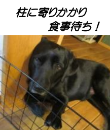
柱に寄りかかり 食事待ち！