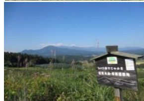
『みやぎ蔵王三十六景』

◎消防訓練 この別荘地のインフラに消火栓が設置されています。町内会やマンションなどでも秋の行事で行われることがありますね！地元の消防署の協力で開催。参加してみました。消防学校を出て配属されたばかりと言う若手の消防官に家庭用消火器の講習を受けました。教え上手でした。