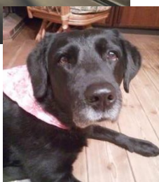
◎今月のnaviちゃん『ワン』ショット！

◎今月の最高気温。たまの散歩も朝、早めに！今年も狂犬病の注射後、町に登録です。平成29年度の登録票です。