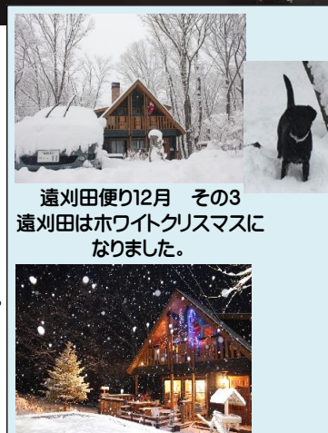
遠刈田便り12月 その3 遠刈田はホワイトクリスマスになりました。

2009年の春頃から始めたようです。現在のような体裁は2010年ころからです。当時は思いついたときに右のような近況報告を書いていたみたいでした。 2009年のクリスマスは写真の様に大雪だったんです。約12年分、読みでありますが結構面白いもんです。