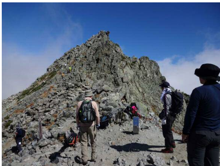
さらにトラバースして「富士ノ折立」へ