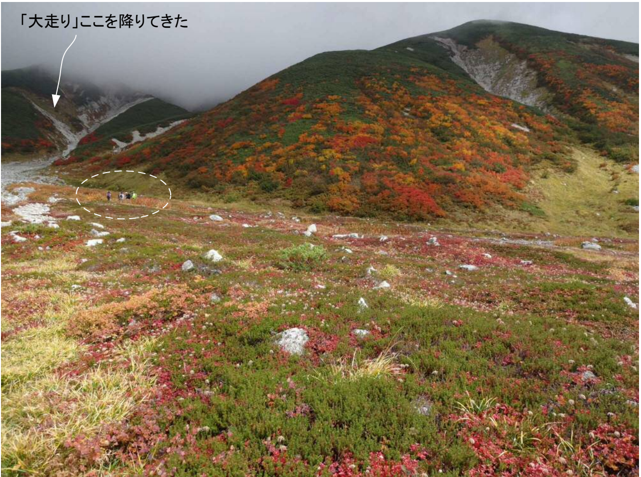
雲の下、雷鳥沢は紅葉天国 結局5時間半の登山でした。