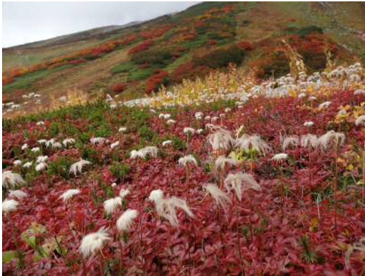
下山した雷鳥沢はどこ見ても紅葉