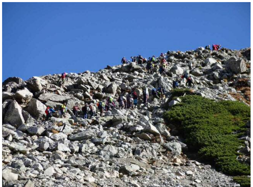
晴天の中、大勢の登山者、砂糖に群がるアリのようにですね。