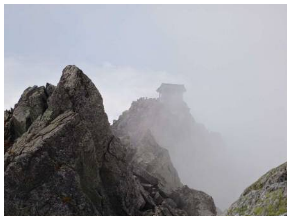
大汝山山頂から雄山神社を望む