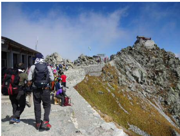
出発から2時間後、やっと雄山神社到着

神社ではスニーカー履きの神主さんから、 ありがたくお祓いを受け、さらに進みます (9月末で、神主さんも下山して居なくなります)