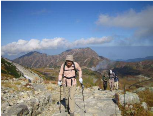
まず上天気の中、「一の越」へ