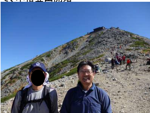
雄山までもう少しで一休み