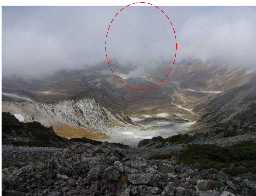
下界の雷鳥沢は雲の下