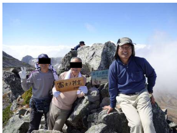
富士の折立山頂、ここで昼食