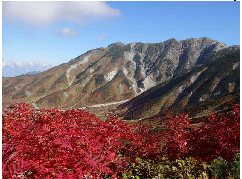
途中はナナカマドが真っ盛りです