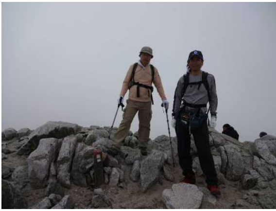
真砂岳山頂では雲の中