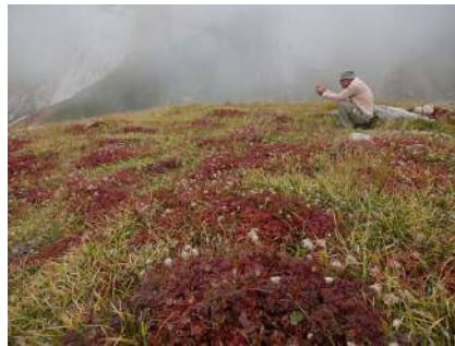
思わずカメラを向ける