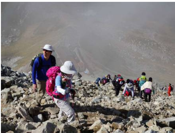
眼下に「一の越山荘」、いざ山頂目指して、本格登山開始